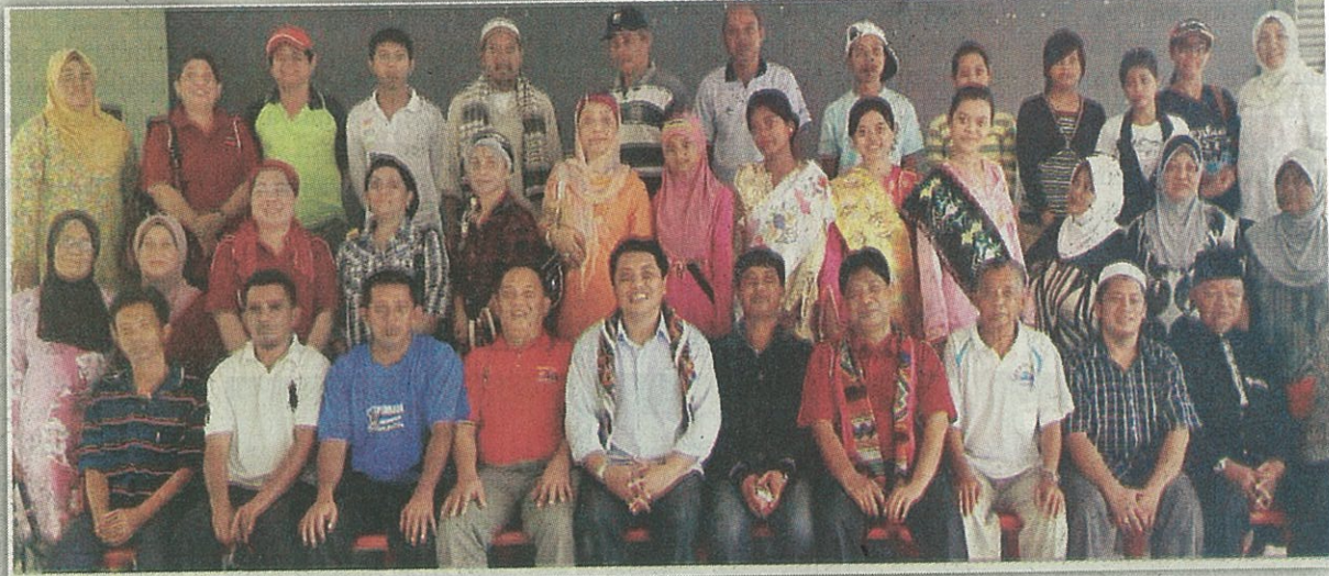
KOMUNITI PUSAKA yang ditubuhkan bertujuan memartabat kesenian dan kebudayaan suku kaum Suluk.