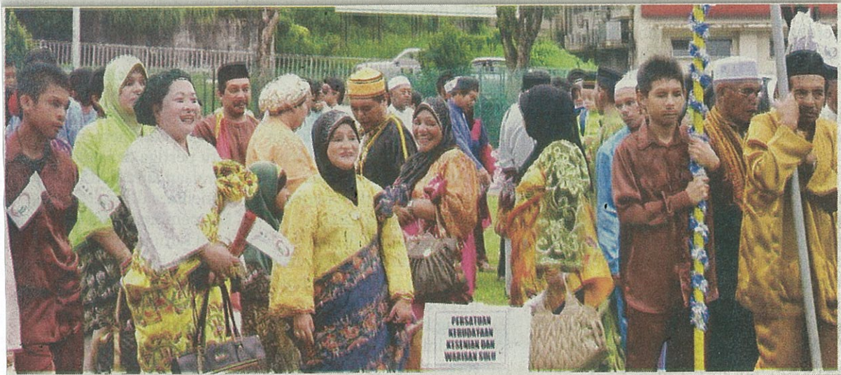
PUSAKA ketika menyertai perarakan sempena sambutan Maulidur Rasul di Sandakan, baru-baru ini.