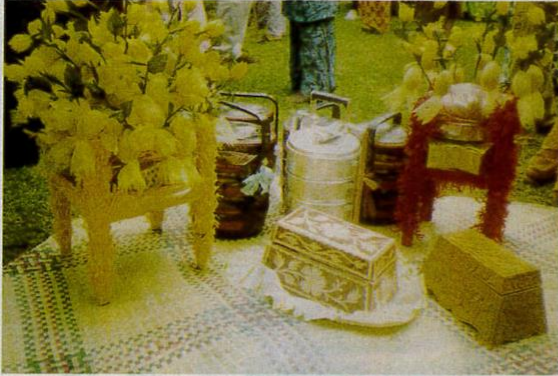
Nasi godang (kiri), boko (tengah), telepak (kanan) dan tepak sirih diletakkan di halaman rumah pengantin perempuan sementara menunggu adat bersanding.