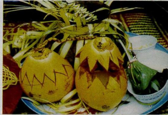
Sebahagian alat-alat yang digunakan untuk upacara bersiram pengantin.

kerjasama, gotong-royong, tolong-menolong, dan bantu-membantu antara pengamal adat perpatih.