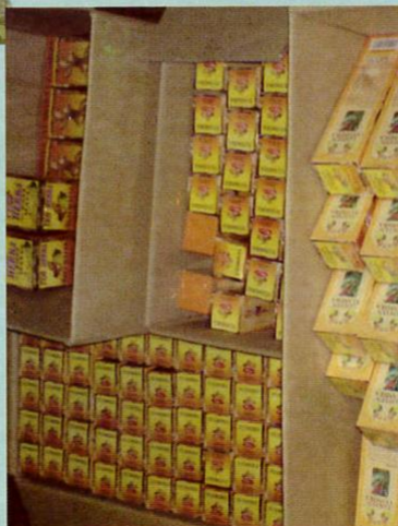
Produk kacip fatimah.

Pengamal perubatan tradisional Melayu mencari pokok kacip fatimah di hutan. Ada juga yang mendapatkan bekalan tumbuhan ini dengan bantuan orang asli dan penduduk yang tinggal berdekatan dengan hutan. Pengamal perubatan tradisional memilih untuk tidak menanam sendiri pokok ini. Hal ini dikatakan demikian kerana pokok yang dikenali sebagai pokok manja ini mudah mati, jika terdedah pada cahaya matahari.