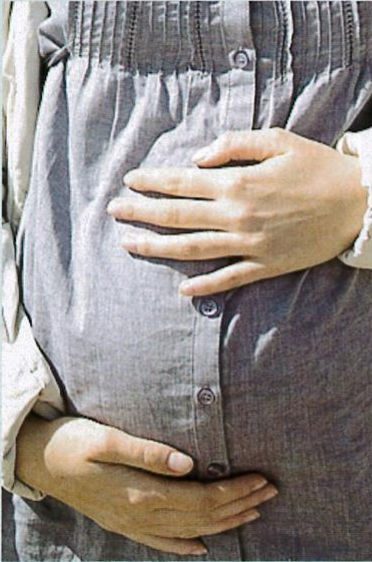
Air rebusan pokok kacip fatimah diminum sebelum bersalin.

Khasiat yang diterangkan oleh pengamal perubatan ini biasanya disusuli dengan penjelasan dari segi reaksi bahan ini terhadap badan. Walaupun tiada kajian saintifik yang menyokong penjelasan ini, kata mereka diyakini berdasarkan pengalaman yang dilalui.