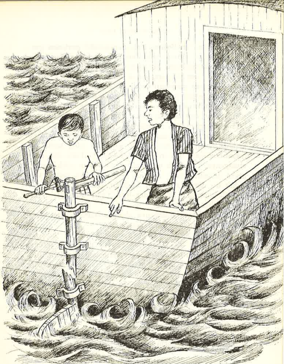
Apabila mereka sampai dekat muara Sungei Baram itu tiba-tiba kemudi perahu mereka pun patah.