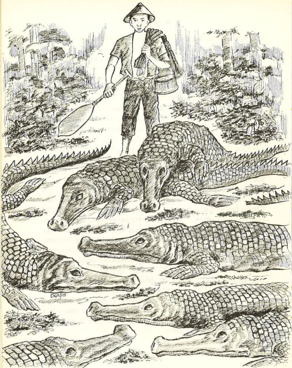
Di-sana ia berjumpa dengan tujuh sarong-rong buaya yang besar.