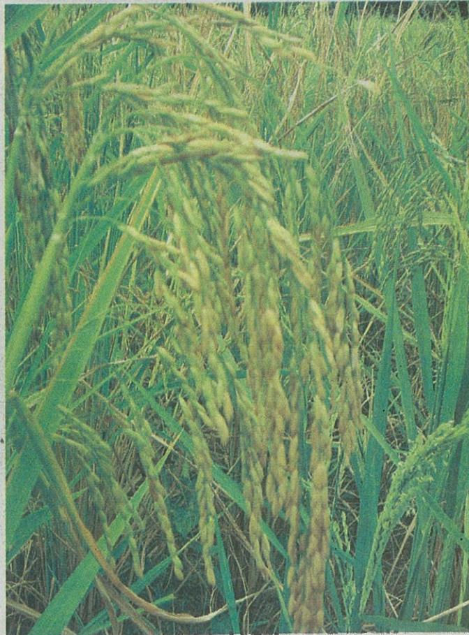
MILAU (November) ketika padi mula mengeluarkan buah. Gambar padi ini juga bersamaan Momuhau (Disember) ketika petani menghalau burung dan haiwan perosak.

Penggunaan asas kalendar adalah untuk mengenal pasti hari agar memiliki panduan tentang kegiatan pada masa hadapan dan merekodkan peristiwa yang berlaku. Kalendar juga digunakan untuk membantu orang ramai mengatur aturcara mereka, masa dan kegiatan seperti di tempat kerja, sekolah dan komitmen keluarga. Kalendar Kadazandusun yang ada sekarang digunakan dalam kurikulum dari peringkat sekolah rendah, sekolah menengah dan institusi pengajian tinggi (IPT).