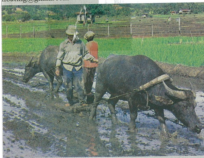
MAGUS (Ogos) ketika membajak sawah untuk tanaman padi.

K ALENDAR Kadazandusun memiliki sistem pengiraan berdasarkan astronomi dan dinamakan mengikut kitaran hidup rama-rama serta musim-musim penanaman padi sawah. Hari-hari dalam seminggu diasaskan kepada kitaran hidup rama-rama. Tontolu adalah Isnin, Mirod (Selasa), Madsa (Rabu), Tadtaru (Khamis), Kurudu (Jumaat), Kukuak (Sabtu) dan Tiwang (Ahad).