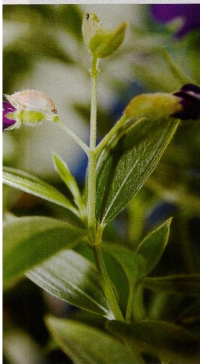
Batang, daun dan buah senduduk berbulu halus berwarna putih.

Akar som dikenali juga dengan nama akar ginseng, akar songsong, ulam ginseng, som jawa, kelesom, turen shen, panicled fameflower root , dan talini paniculati radix . Nama saintifik bagi akar som ialah Talinum paniculatum gaertn dan tergolong dalam keluarga Portulacaceae .