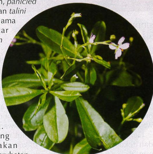
Bunga akar som.

Antara khasiat yang diperoleh melalui daun yang dijadikan ulam adalah dapat menambahkan selera makan dan meningkatkan kecerdasan badan. Bagi ibu yang menyusukan anak, daun akar som dapat menambahkan susu badan. Bagi kanak-kanak yang sering diserang penyakit bisul, hancurkan daun dan campur sedikit gula merah, kemudian tampal pada bisul untuk mempercepatkan proses penyembuhan.