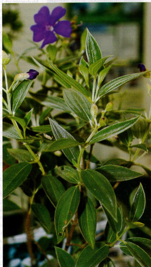
Senduduk berbunga ungu.

Dalam bidang perubatan tradisional, pokok senduduk digunakan sebagai bahan untuk mengembalikan kecergasan badan, terutamanya selepas bersalin. Air rebusan daun senduduk yang dicampurkan daun mengkudu, serai wangi, daun pandan dan limau purut dijadikan air mandian wanita selepas bersalin. Meminum air rebusan daun senduduk tua yang gugur dapat menyembuhkan luka dalaman selepas bersalin. Air ini juga mujarab untuk merawat cirit-birit, berak berdarah dan buasir. Daunnya yang dilumatkan dapat menghilangkan parut akibat demam campak, menghentikan darah akibat luka dan menjadi penawar bisa gigitan binatang.