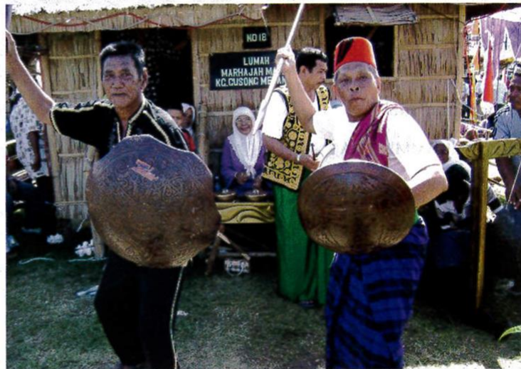
Aksi sayau yang menyerlahkan ciri-ciri kepahlawanan.

Pada masa ini, sayau menjadi pengisi waktu dalam majlis-majlis keceriaan. Bujak dan perisai tetap menjadi ciri-ciri khas kepada sayau . Bujak diperbuat daripada kayu sepanjang lima kaki. Perisainya pula diperbuat daripada kayu yang ditarah mengikut ukuran tertentu, memiliki tangkai dan diukir pada permukaan luar.