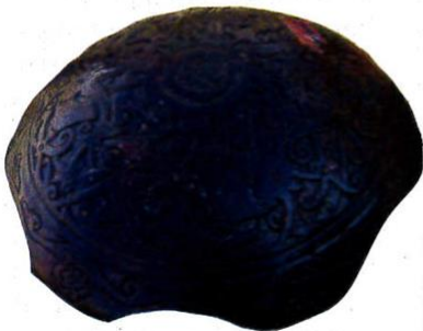
Perisai yang diperbuat daripada kayu.

Sayau adalah singkatan daripada "magsayau", iaitu tarian yang menampilkan aksi membawa bujak (lembing)