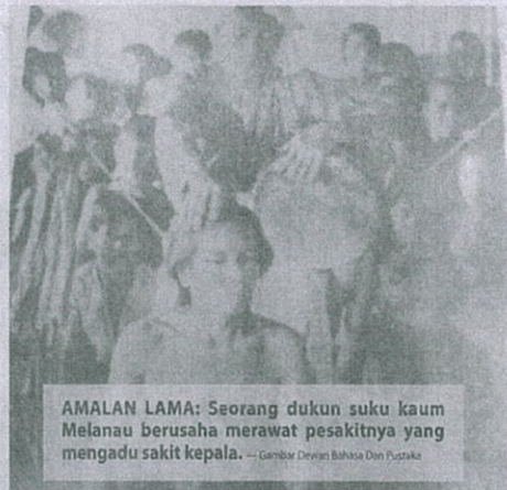
AMALAN LAMA: Seorang dukun suku kaum Melanau berusaha merawat pesakitnya yang mengadu sakit kepala. — Gambar Devian Bahasa Din Pustaka

Amalan beromon mungkin boleh diterima jika penyakit yang dihadapi dipercayai tidak dapat dirawat oleh doktor. Namun, pada masa ini rawatan moden terbukti dapat menyembuhkan banyak penyakit dan senang diperolehi.