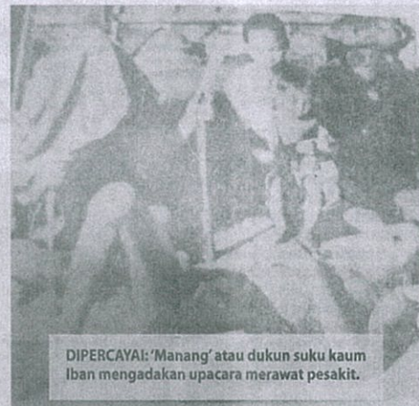
DIPERCAYAI: 'Manang' atau dukun suku kaum Iban mengadakan upacara merawat pesakit.