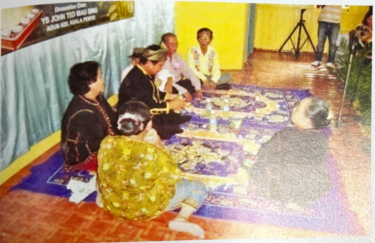
Sekumpulan lelaki dan wanita sedang berbalas 'Badaup'.

Badaup merupakan sejenis pantun atau nyanyian yang diungkapkan semasa Dusun Tatana mengetam padi. Nyanyian ini dilakukan untuk menghilangkan rasa penat dan bosan semasa aktiviti mengetam padi.