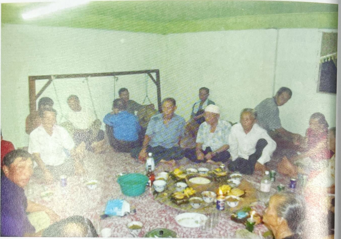
Sekumpulan lelaki dan wanita yang sedang berbalas 'Bolibag' semasa upacara 'Moginum'.

Bolibag merupakan sejenis pantun seperti Mibobogoh . Walau bagaimanapun, Bolibag dan Mibobogoh boleh dibezakan melalui alunan suara semasa menyanyikannya. Selain itu, Bolibag juga boleh diucapkan dalam pelbagai jenis majlis keramaian seperti majlis perkahwinan dan lain-lain. Keanggotaan Bolibag adalah bebas yang terdiri daripada ahli lelaki dan wanita yang akan menyanyi Bolibag bersama-sama.