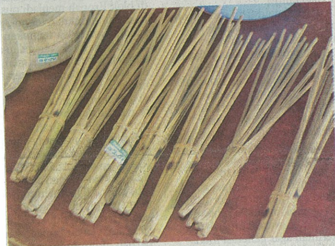
CANDAS iaitu alat untuk menikmati juadah ambuyat, salah satu makanan kegemaran kaum Kadayan.