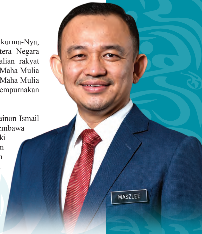
DR. MASZLEE MALIK

Sebagai Pengerusi Panel Anugerah Sastera Negara Ke-14, saya merakamkan setinggi-tinggi penghargaan dan terima kasih kepada semua pihak yang terlibat sejak bermula proses penilaian sehinggalah kepada pelaksanaan majlis pada malam ini. Sesungguhnya sumbangan ini sangat berharga ke arah memartabatkan persuratan Melayu.