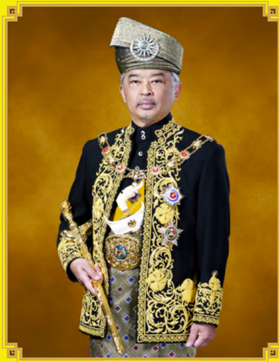
KEBAWAH DULI YANG MAHA MULIA SERI PADUKA BAGINDA YANG DI-PERTUAN AGONG AL-SULTAN ABDULLAH R'AYATUDDIN AL-MUSTAFA BILLAH SHAH IBNI ALMARHUM SULTAN HAJI AHMAD SHAH AL-MUSTA'IN BILLAH