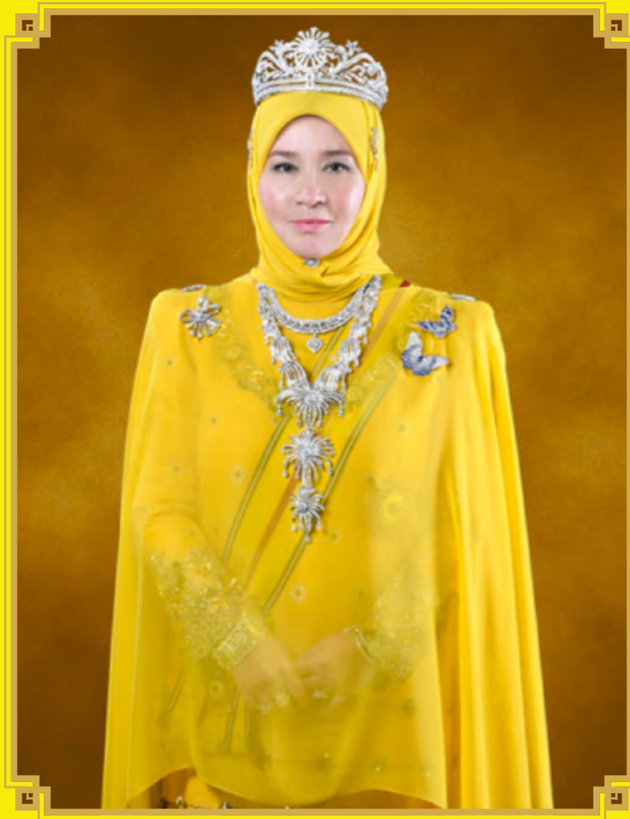
KEBAWAH DULI YANG MAHA MULIA SERI PADUKA BAGINDA RAJA PERMAISURI AGONG TUNKU HAJAH AZIZAH AMINAH MAIMUNAH ISKANDARIAH BINTI ALMARHUM AL-MUTAWAKKIL ALALLAH SULTAN ISKANDAR AL-HAJ