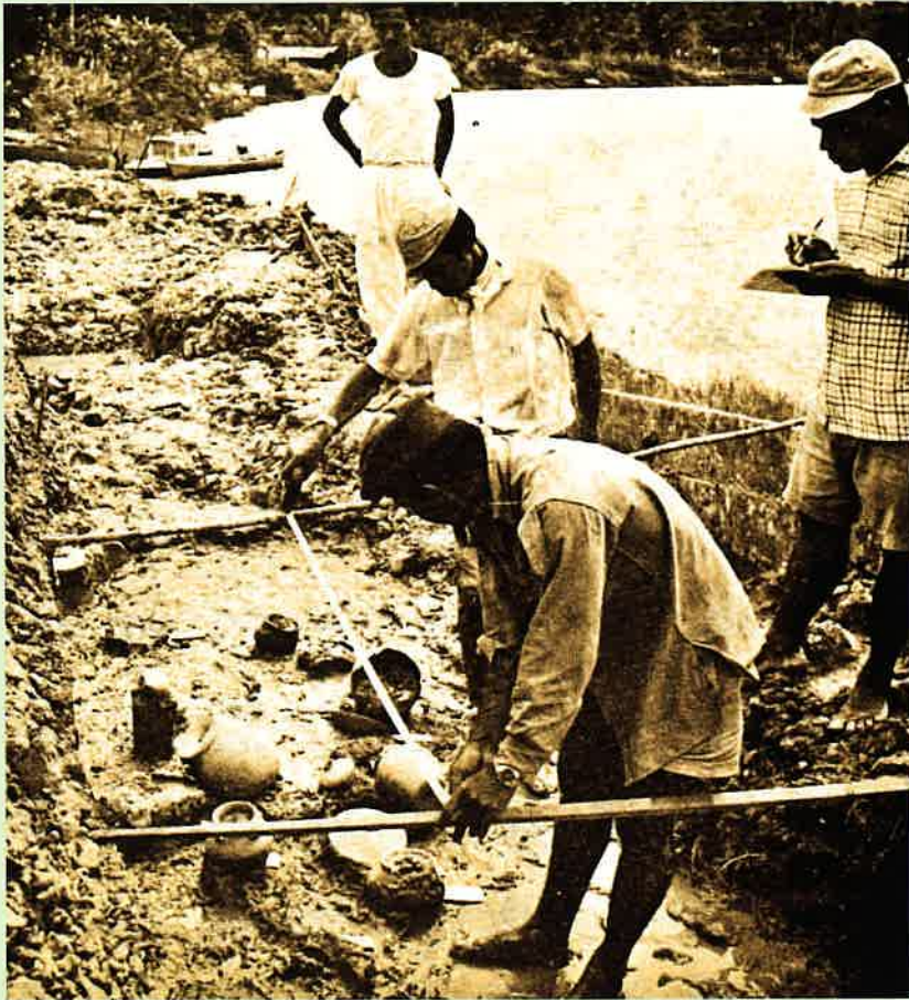
Foto 1.3. Kegiatan cari gali yang sedang dilakukan di Gedong.

juga dikenali bahagian Hulu Batang Sadong. Gua Sireh terletak di kawasan tanah tinggi berhampiran dengan Gunung Sedong. Gunung Sedong telah menganjur terus dengan satu Banjaran Bongo dengan Gunung Penrissen yang juga merupakan persempadanan antara Malaysia (Sarawak) dengan Indonesia (Kalimantan Barat).