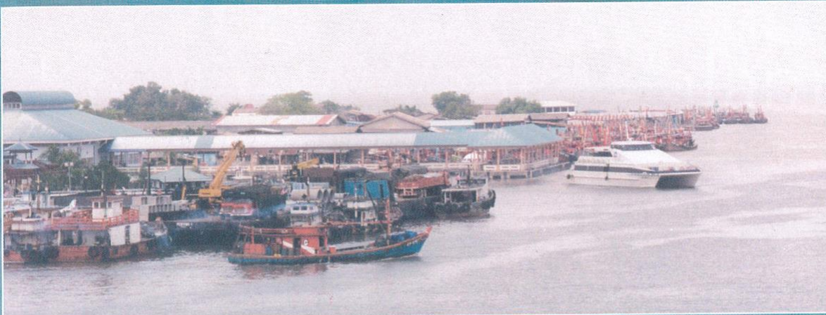
Perahu dan feri menghidupkan pelabuhan Kuala Kedah.