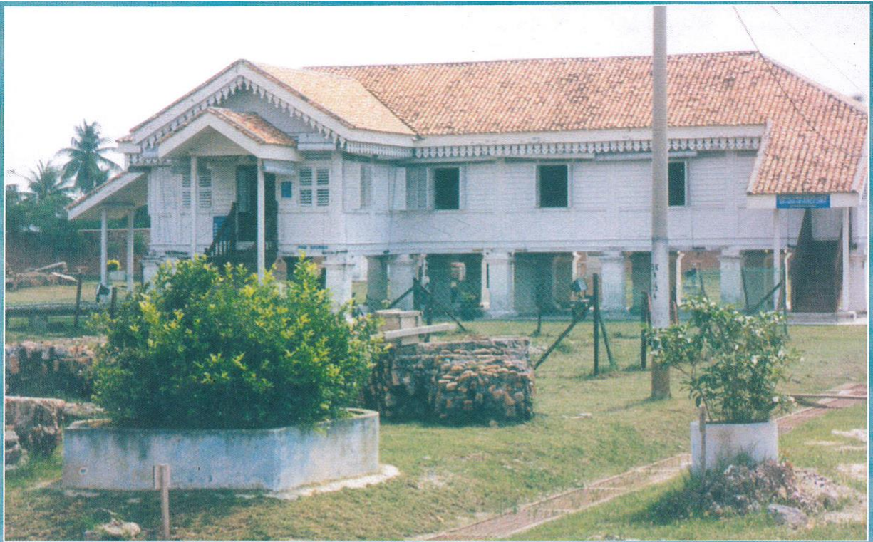
Bangunan Lama Pusat Pentadbiran dalam Kota Kuala Kedah.