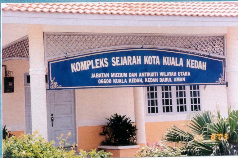
Bangunan kompleks Sejarah Kota Kuala Kedah.