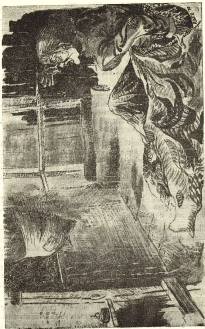
Orang tua itu menggigit kesejukan.