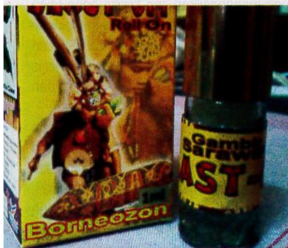
Gambir sarawak dikomersialkan untuk kegunaan luaran dan bukan untuk dimakan.

agen antikerengsaan, antiulser dan sangat berguna kepada pesakit saraf.