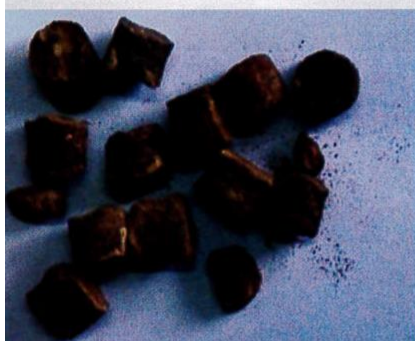
Gambir sarawak digunakan secara meluas dalam rawatan perubatan tradisional.