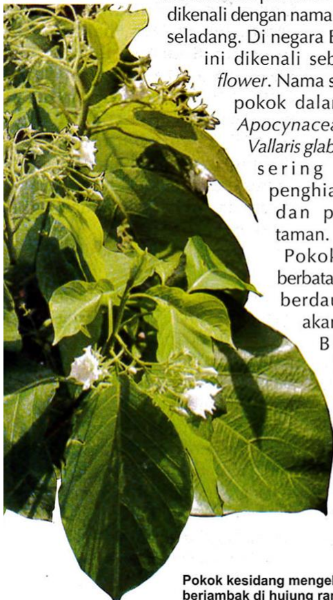
Pokok kesidang mengeluarkan bunga berjambak di hujung ranting.