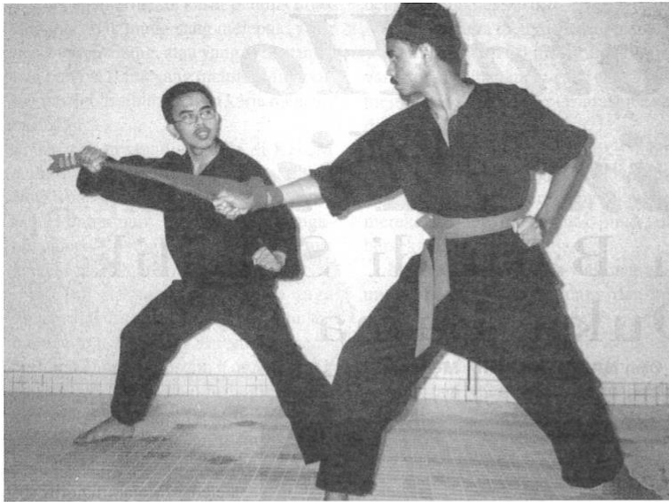
Kain merupakan senjata utama seni cindai.