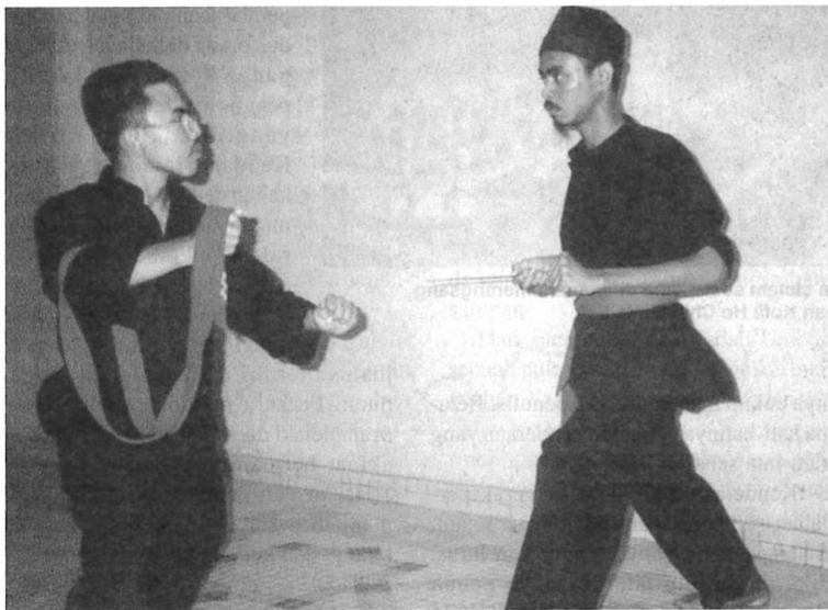
Seni cindai mengajar penuntutnya memerangkap, mengelak dan menyerang musuh.

Sebagai contoh, terdapat kepercayaan di kalangan pengamal ilmu cindai ini kononnya kain cindai yang ditenun oleh seorang anak dara sunti adalah lebih berbisa jika dibandingkan daripada kain yang lain. Kepercayaan ini sememangnya tidak boleh diterima.