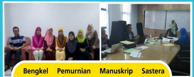
Bengkel Pemurnian Manuskrip Sastera Dewasa 2019 pada 16-17 Mac 2019 di DBPCS.