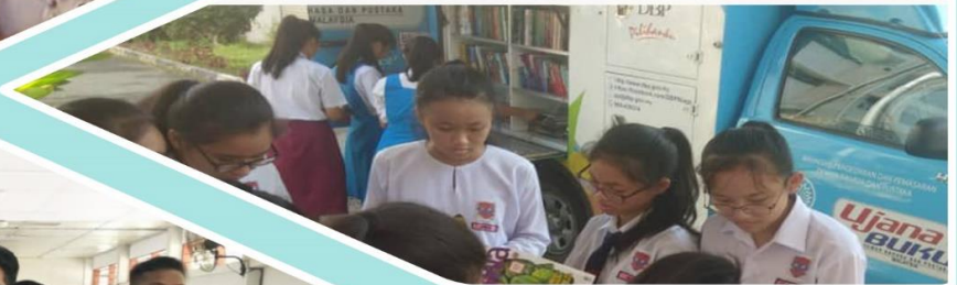
26 Februari 2019 Pameran dan Jualan Ujana Buku DBP di SMJK Shan Tao, Kota Kinabalu.