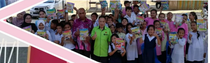
14 MAC 2019 Program Majalah dalam Kelas (MDK) di SK Ulu Kukut, Kota Belud.