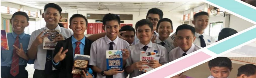
26 Februari 2019 Pameran dan Jualan Ujana Buku DBP di SMK Likas, Kota Kinabalu.