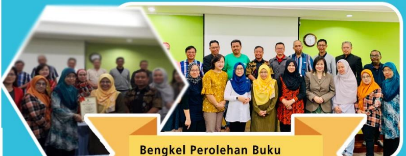
Bengkel Perolehan Buku Sastera Dewasa pada 30-31 Mac 2019 di DBPCS