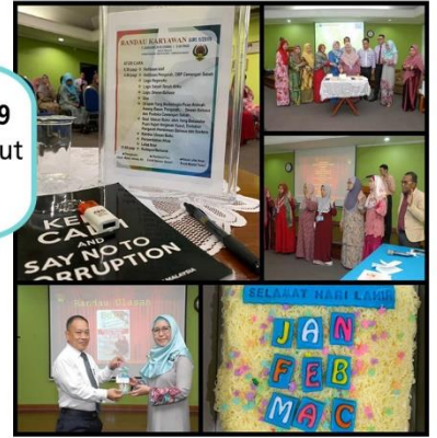
Randau Karyawan Siri 1/2019 pada 7 Januari 2019 di Sudut Penulis, DBPCS.