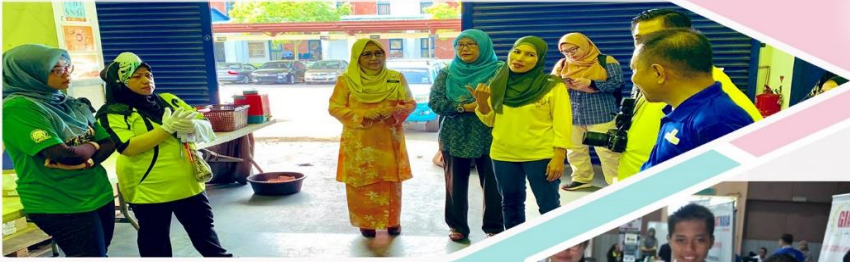
14-16 Januari 2019 Semakan Stok Fizikal (SSF) di DBP Cawangan Sabah.