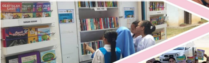
12 Mac 2019 Pameran dan Jualan Ujana Buku DBP di SMK Sg. Damit, Tamparuli.