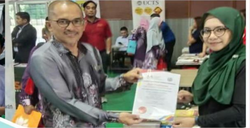
14 Februari 2019 Pameran dan Jualan Ujana Buku DBP di SMK Tun Juhar, Sandakan.