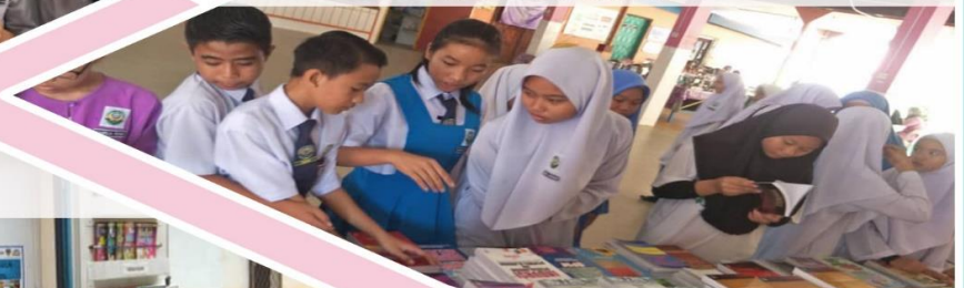
11 Mac 2019 Pameran dan Jualan Ujana Buku DBP di SMK Beaufort II.