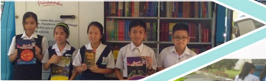
14 Februari 2019 Pameran dan Jualan Ujana Buku DBP di Pusat Kegiatan Guru Tamparuli.