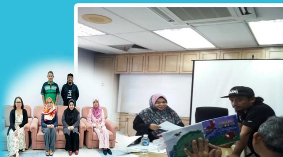
Bengkel Penyediaan Dami Buku Bergambar Kanak-kanak DBP-YS pada 23-24 Februari 2019 di DBPCS