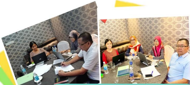
Bengkel Pemurnian Kamus Lotud Melayu Dewan pada 22-25 Februari 2019 di Hotel Grand Borneo, Kota Kinabalu.