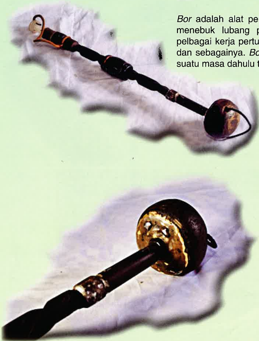
Foto 4.2 Hulu bor berbentuk bulat bagi memudahkan hulunya dipegang semasa kerja-kerja menebuk dilakukan. Selain itu, hulu bor juga boleh disandarkan ke bahu untuk menambahkan tekanan apabila kerja-kerja menebuk dinding.

Bor adalah alat pertukangan lama yang berfungsi untuk memudahkan kerja menebuk lubang pada permukaan kayu. Peralatan ini digunakan dalam pelbagai kerja pertukangan kayu seperti membina rumah, perahu, hulu parang dan sebagainya. Bor amat terkenal dalam kalangan masyarakat Gedong pada suatu masa dahulu terutamanya dalam urusan pertukangan.