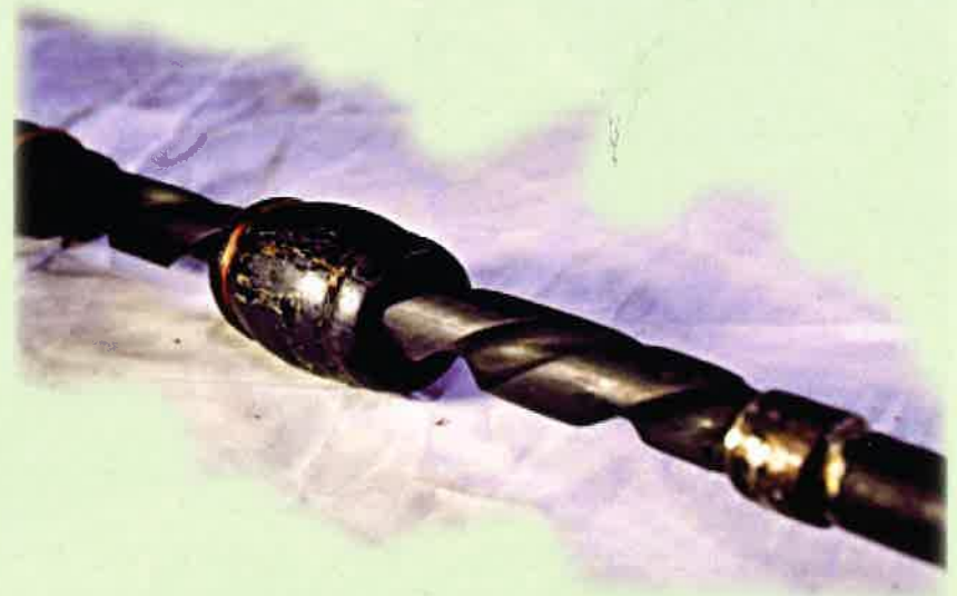
Foto 4.3 Bahagian tengah bor diperbuat daripada kayu belian sebagai pemutar pada mata bor semasa kerja menebuk permukaan kayu.