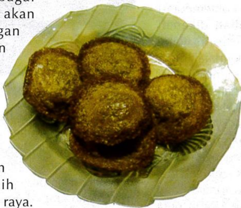
Kuih pinjaram .

tompinainya . Pengunjung daripada suku kaum Iranun akan membawa ikan kering, kuih-muih dan tubau (sejenis tenunan oleh suku kaum Iranun) sebagai buah tangan. Mereka akan bermalam di perkampungan Kadazan-Dusun selama dua atau tiga hari. Ketika mereka pulang, mereka akan membawa buah-buahan seperti durian, tarap ,