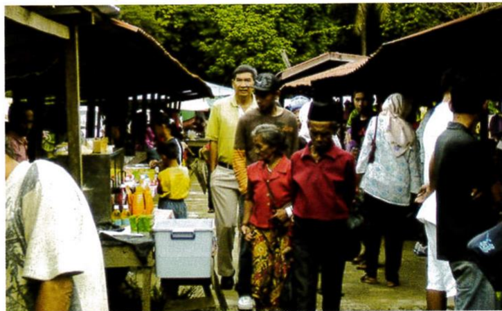
Suasana Tamu Selasa di Kampung Pandasan, Sabah.

Suatu ketika dahulu, terutamanya tiga hari sebelum hari perayaan, pengunjung sudah berada di perkampungan masyarakat Iranun. Mereka berusaha datang seawal mungkin semata-mata tidak mahu melepaskan peluang