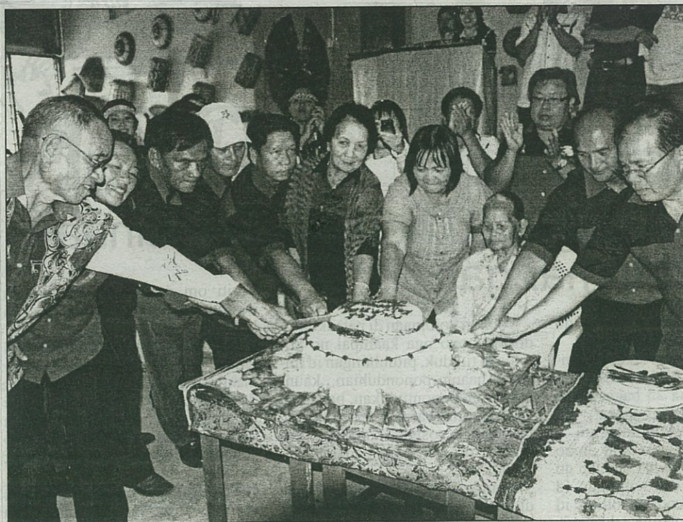
KEK TRADISIONAL ... Kelihatan wakil-wakil keturunan Antanom dari Nabawan, Kemabong dan Sipitang (Sabah), Limbang Sarawak dan Brunei sama-sama memotong kek sebagai tanda penyatuan keturunan Antanom.

Majlis yang sederhana tetapi penuh dengan makna itu turut di-