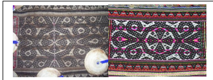
Rajah 33: Motif Nantudungan Nu Dalaing