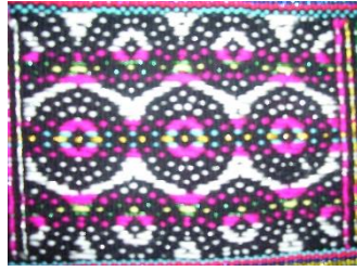
Rajah 26: Motif Binulan