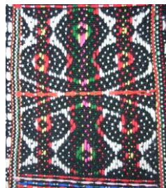
Rajah 27: Motif Inampoi

Maksud Tersirat: Dahulu masyarakat Murut Baukan menjadikan bulan sebagai panduan menggantikan kalender untuk menghitung sesuatu musim. Menurut Encik Dugai, apabila bulan keluar, masyarakat Murut Baukan akan mula membuat perancangan untuk membuat tabasan/ bendang. Biasanya mereka mengamalkan semangat bergotong-royong. Mereka akan mula berbincang tentang giliran untuk bergotong-royong. Pada masa itu juga tidak ada kemudahan bekalan elektrik, semasa bulan penuh muncul biasanya mereka bercerita dan berbincang di beranda dengan mengharapkan sinaran bulan terang. Pada masa bulan terang juga mereka mencari rezeki di hutan, seperti memburu binatang dan memancing. Bentuk bulan penuh ini seterusnya dilahirkan dalam anyaman dan tenunan sulayau , menghasilkan motif yang menarik. Amalan gotong-royong dan berburu dalam kalangan masyarakat Murut Baukan masih diteruskan sehingga hari ini.