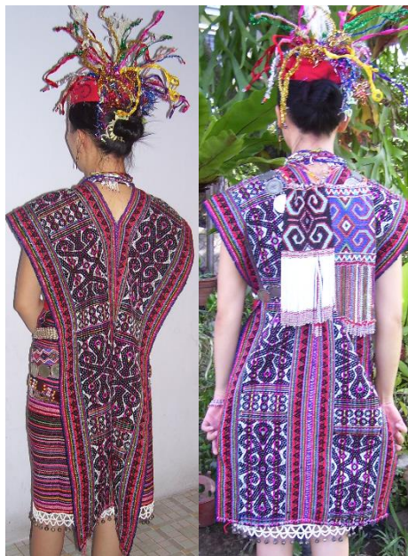
Rajah 20: Pandangan dari bahagian belakang pakaian Murut Bookan

Takin /hiasan leher manik berjurai boleh diletakkan di bahagian hadapan semasa mengambil gambar bagi acara sebenarnya perlu letakkan sebagai hiasan bahagian belakang.