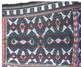
Rajah 28: Motif Pinungu Lansat