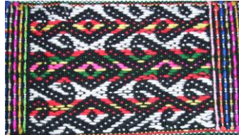
Rajah 30: Motif Rinangkai Di Pinatalingkad

bangga dan gagah seseorang manusia. Corak ini hanya dihasilkan oleh suku kaum Murut Baukan, dan merupakan lambang kekuatan suku kaum Murut Baukan suatu ketika dahulu. Ia merupakan corak/motif yang dianggap tertua dan hanya milik suku kaum Murut Baukan. Dipercayai bahawa suku kaum Muru lain tidak menghasilkan motif ini.