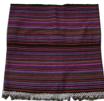
Rajah 6: Tapi/linampog (sarung) using knitting yarn