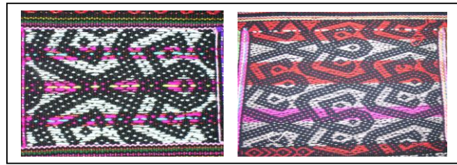
Rajah 35: Motif Binangkawot

Murut. Menurut G.C. Woolley, segala gambar dan meklumat diperolehi dari British Museum dalam Journal in September 1929.