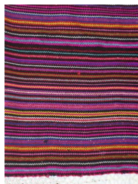
Rajah 36: Motif Bibiasan

Maksud Tersirat: Motif ini merupakan motif yang dianggap paling ringkas. Ianya lebih berbentuk geometri iaitu segi empat dan palang yang berselang seli. Maksud perkataan unsang ialah ringkas. Dalam kehidupan masyarakat Murut Baukan mereka mengamalkan cara hidup yang paling ringkas/ cincai . Ringkas yang dimaksudkan asal ada. Jika kita melihat kehidupan masyarakat Murut Baukan jauh ketinggalan berbanding bangsa lain, hal ini sebenarnya kerana mereka mengamalkan kehidupan yang ringkas. Mereka kurang mementingkan kebendaan/ materialistic . Sikap dan semangat yang tertanam menyebabkan mereka terus ketinggalan sama ada dari segi pelajaran ataupun dari segi ekonomi. Masyarakat Murut Baukan mengamalkan cara kehidupan yang paling ringkas seperti dalam masakan, hiasan rumah dan kehidupan mereka keseluruhannya. Motif ini agak kurang popular, mungkin kerana maksud di sebalik motif yang kurang membakar semangat.