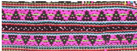
Rajah 36: Motif Linoop Silad

Maksud Tersirat: Linoop bermaksud berlapis-lapis dan silad bermaksud daun palas. Bagi masyarakat murut zaman dahulu mereka menjadikan daun palas sebagai atap rumah. Selain itu, daun palas/silad di gantung pada tiang rumah atau penjuru rumah yang sebagai hiasan untuk memeriahkan sesuatu keramaian, seperti majlis pertunangan atau perkahwinan. Daun salad/palas akan dicarik-carik kemudian dikeringkan, apabila kering daun tadi kelihatan keriting dan kembang. Sekarang daun palas juga dijadikan aksesori untuk penari lelaki semasa menari dengan menggantungkan pada bahu hingga ke paras pinggul. Bagi masyarakat Melayu daun palas digunakan untuk membuat ketupat.