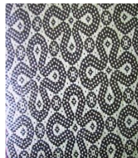
Rajah 22: Anyaman tikar menggunakan motif pinungu langsung