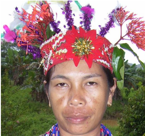
Rajah 10: Hiasan Kepala terdiri dari bunga hidup dan bunga plastik (sisikot) dan ikatan kepala (kukulos) dihias dengan pelbagai manik, labuci dan renda.