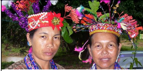
Rajah 9: Pelbagai bentuk hiasan pada bahagian kepala kostum Murut Bookan