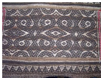
Rajah 32: Motif Pinogkotob

Maksud Tersirat: Masyarakat Murut baukan separti yang diketahui umum, terlalu rapat dengan kehidupan di hutan semulajadi yang belum tercemar. Bukan sahaja mereka mendapat inspirasi daripada makhluk yang hidup di langit, darat tetapi juga di dalam air khususnya sungai. Sehingga kini masyarakat Murut Baukan masih menjadikan sungai sebagai tempat membersihkan diri atau mandi manda. Mereka sangat rapat dengan kehidupan di sungai, kerana sungai menjadi sumber rezeki untuk mendapatkan sumber air dan makanan seperti ikan air tawar, siput, kura-kura, labi-labi, ketam dan biawak. Biasanya mereka juga akan memilih untuk mendirikan rumah berhampiran dengan sungai. Semasa menjalankan aktiviti seharian mereka di sekitar sungai, biasanya mereka akan bertemu ular air yang dikenali sebagai 'lingangadui'. Mereka tidak akan membunuh mahupun mengganggu ular ini kerana mereka percaya bahawa sekiranya ular ini diganggu ia akan bertambah banyak dan mereka tidak akan dapat melakukan aktiviti di sungai. Semasa mereka mananti ular air/ lingangadui ini beredar dengan cara berenang di permukaan air mereka akan memerhati pergerakan ular yang berliku-liku/ zig zag . Dari pemerhatian inilah mereka melahirkan inspirasi tersebut untuk menghasilkan motif pada sulayau. Motif lingangadui ini biasanya hanya dijadikan pemisah/ border di antara motif utama. Tujuan pemisah/border ini untuk memberi sempadan antara satu motif dengan motif yang lain.