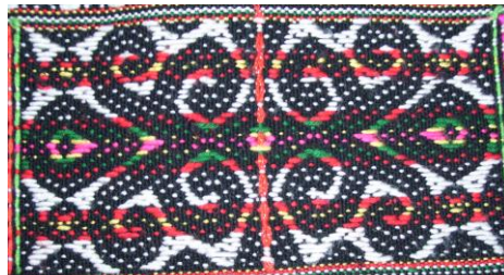
Rajah 29: Motif Imambau da kiranitanan

langsap yang telah dikumpul secara sama rata. Semasa aktiviti ini mereka dapat mengeratkan tali persaudaraan dengan mengamalkan persefahaman, bertolak ansur, semangat kekitaan, adil, berkongsi dan tolong-menolong. Demikian juga amalan ini dilakukan oleh keluarga lain, bukan sahaja buah langsung tetapi buah-buahan yang lain dan binatang hasil buruan juga. Kini amalan ini semakin kurang diamalkan kerana hanya ahli keluarga yang terdekat atau sekeluarga sahaja yang akan dipanggil untuk memetik buah. Walaupun amalan ini semakin hilang ditelan zaman, namun semangat ini akhirnya dapat dilahirkan melalui hasil motif ukiran, anyaman dan tenunan pinungu lansat (buah langsung).