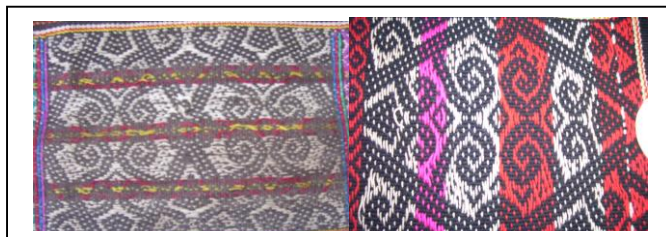
Rajah 34: Kinudu Da Pinatingkop

Biasanya, alet ini disikut oleh lelaki Murut baukan. Kegunaan alet ini adalah untuk mengangkat kayu api, ubi kayu atau binatang. Selain dari itu kanak-kanak Murut Baukan sering menghabiskan masa bermain di atas tanah. Semasa bermain mereka biasanya akan duduk di atas tanah, ini akan meninggalkan kesan bentuk kedudukan kanak-kanak duduk. Mereka seterusnya melahirkan corak tersebut, dengan menokok tambah agar menjadi corak yang cantik pada tenunan sulayau sebagai melahirkan rasa kasih dan penghargaan kepada kanak-kanak. Kanak-kanak sangat dihargai kerana bakal menjadi penyambung generasi dan akan menjaga kedua ibu bapa pada masa mereka tua kelak.