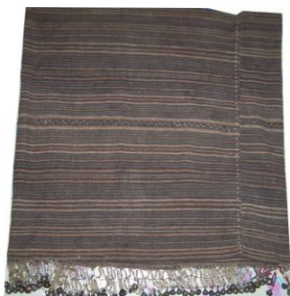
Rajah 5: Tapi/linampog (sarung) menggunakan benang yang dipintal secara tradisional, Kini tidak lagi dihasilkan.