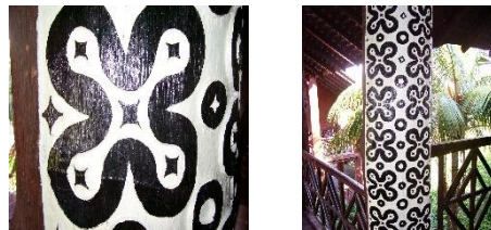
Rajah 21: Ukiran motif pinungu langsung pada tiang rumah

Walaupun, masyarakat Murut sangat kaya dengan kesenian dan kebudayaan. Selain mahir berburu mereka juga mahir dalam membuat kerja tangan seperti ukiran, menjahit manik, anyaman, tenunan dan banyak lagi. Dalam perbualan dengan Encik Dugai, Ketua Kampung Mapila pada 6 Jun 2006, beliau mengatakan bahawa pada zaman dahulu masyarakat Murut buta huruf kerana perkembangan pelajaran lambat sampai kepada mereka. Segala idea atau buah filiran dan peristiwa yang berlaku mereka rakamkan (rekodkan) dalam bentuk motif /corak. Motif ini dihasilkan dengan cara mengukir pada kayu, menganyam tikar atau menenun pada sulayau . Melalui motif ini, ianya sedikit sebanyak dapat menceritakan kisah hidup dan amalan budaya suku kaum Murut khususnya Murut Bookan.