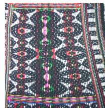
Rajah 23: Tenunan sulayau menggunakan motif pinungu langsung

Gambar di atas menunjukkan bahawa motif telah dipindahkan dan diperkayakan dengan menggunakan beberapa teknik dengan menghasilkannya dalam pelbagai bentuk persembahan, seperti ukiran pada tiang rumah, anyaman pada tikar dan tenunan pada sulayau .