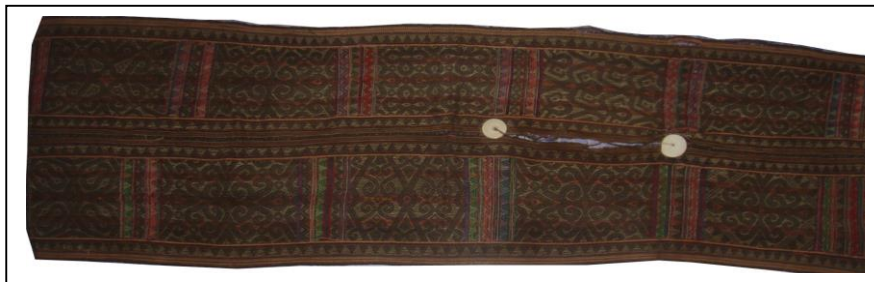
Rajah 3: Sulayau 1, ditunen menggunakan benang daripada daun nenas yang dipintal dan diwarnakan secara tradisional menggunakan pewarna asli.

Sulayau merupakan sehelai pakaian bahagian atas yang ditunen dengan pelbagai motif yang unik dan kreatif. Semasa dipakai bahagian hadapan lebih pendek, iaitu paras punggung manakala bahagian belakang lebih panjang mencecah hingga ke paras betis pemakai. Contoh-contoh berikut merupakan antara hasil tenunan Adu Mampan.