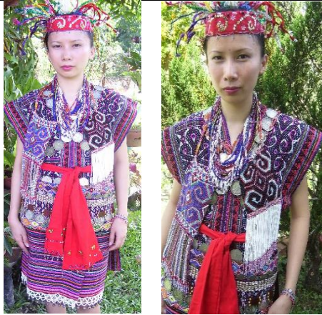
Rajah 19: Pandangan dari bahagian belakang pakaian Murut Bookan

Takin /hiasan leher manik berjurai boleh diletakkan di bahagian hadapan semasa mengambil gambar bagi acara sebenarnya perlu letakkan sebagai hiasan bahagian belakang.