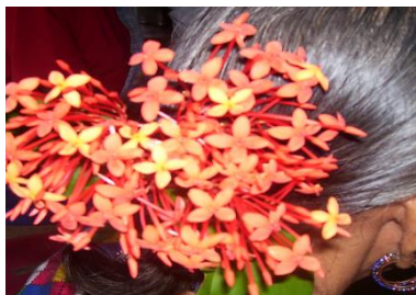
Rajah 11: Hiasan bunga hutan yang sering di kenakan.

Hiasan kepala melengkapkan pemakaian pakaian tradisional wanita Murut Baukan.