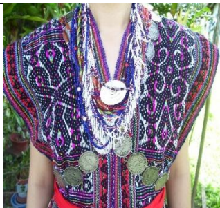
Rajah 12: Hiasan bahagian dada sulayau

Bahagian dada dihiasi dengan rantai manik berwarna-warni dan sedondon dengan baju sulayau . Biasanya rantai manik ini dipakai dalam kuantiti yang banyak, namun mengikut kemampuan pemilik. Semakin banyak, maka ia semakin cantik dan kelihatan mewah.