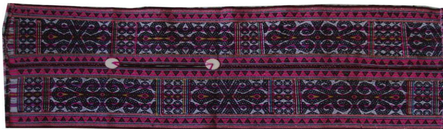
Rajah 4: Sulayau 4 ditunen menggunakan benang bulu