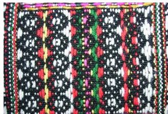
Rajah 25: Motif Sinundukan nu tuali