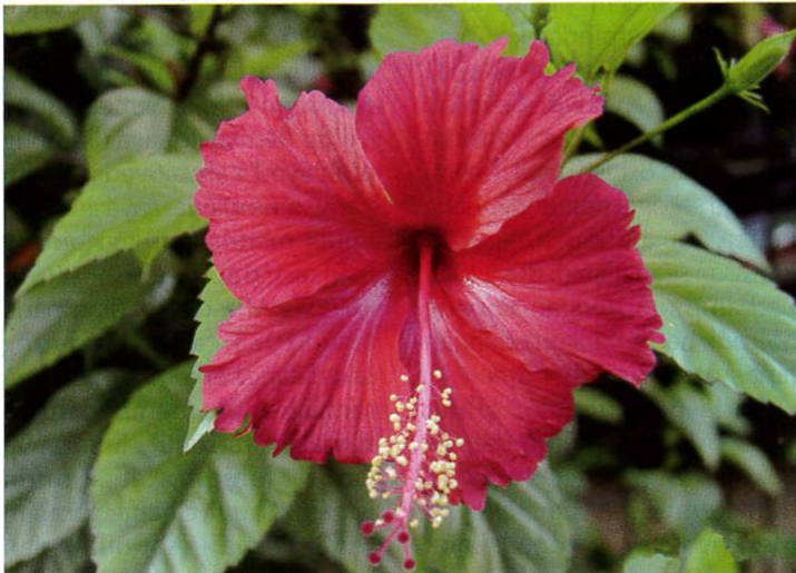
Bunga raya berwarna merah berkelopak lima menjadi bunga kebangsaan Malaysia.