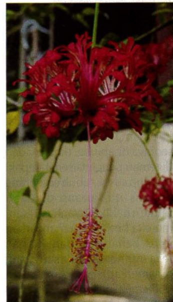
Antara spesies bunga raya yang terdapat di Malaysia.